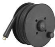
Enrollador con manguera