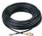
Manguera Canalización 25m